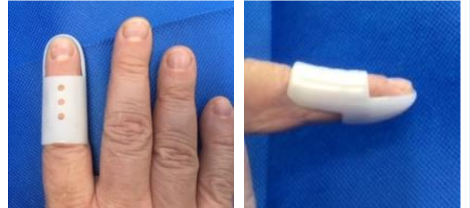
Çekiç Parmak ateli