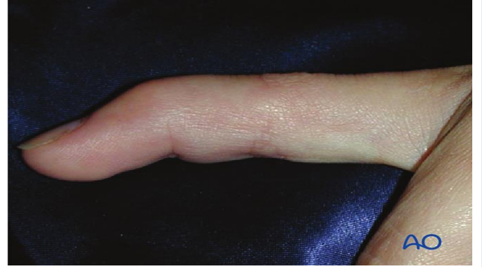
Çekiç Parmak yaralanması